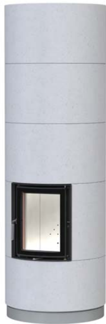
KSO 33 r